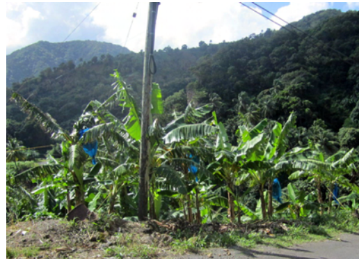
Bananklasar klädda i blå plast

Staden vid Prince Rupert Bay heter Portsmouth och ser mer ut som en by som sträcker sig längs bukten. Det visar sig senare att ovanför byn finns en stor stadsdel, som är som en mindre universitetsstad, med olika internatskolor för amerikanska studenter. Här finns allt det som inte finns nere i den äldre delen, shoppingcenter, snabbmatskedjor och klädaffärer.