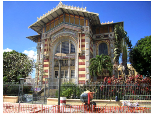
Schoelchers bibliotek, Fort de France

Byggnaden uppfördes i Paris 1889, plockades ner i bitar, skeppades över hit och restes upp igen.