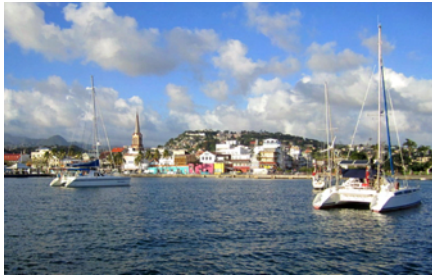
Mitt i stan - Fort de France

Först efter ett några dagar gick vi över till själva Fort de France. Storstad, med allt vad det innebär; affärer, bilar, puls, rödljus, livemusik, vackra byggnader, gågata, vilket utbud!