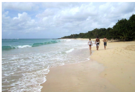
Vita stränder, här vid Grand Anse de Salines