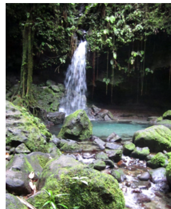
Men ett svalkande dopp kanske?

Vi besökte Emerald Pool och precis som man kan gissa av namnet slutar fallet i en härlig sötvattenspool där den som önskar kan ta sig ett svalkande dopp.