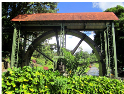
Vattenhjulet som en gång drev allt