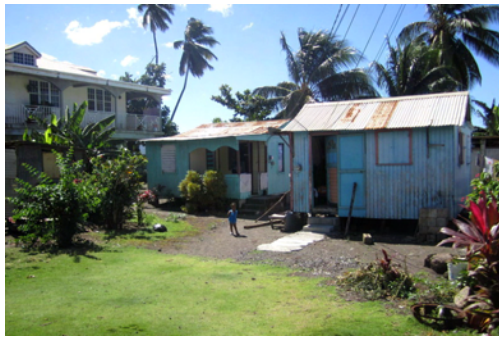
Snyggt & prydligt oavsett bostadstyp

Ingen borde svälta här för överallt växer det, bland annat bananer, granatäpplen, mango, kokosnötter och passionsfrukter.