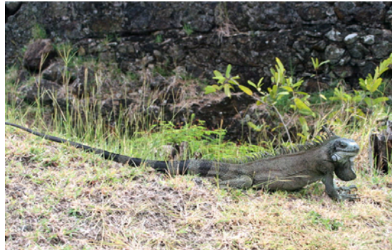
Där fann vi denna iguan!