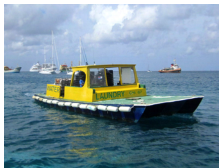
Köpa vatten, diesel eller lämna tvätt?

Det kan man tacka alla boatboys för. En företeelse vi har hört mycket om, mest negativt. Vi har aldrig haft problem utan tvärtom varje gång blivit trevligt bemötta. När vi tackat nej till något erbjudande har de ofta varit hjälpsamma ändå. Även när vi inte handlat av dem har det alltid varit glada miner och en god ton. Detta är entreprenörer, som en gång var boys, men som nu växt upp och lärt sig vad kunden vill ha. De skapar sin inkomst under några få månader varje år. Jag tror lite grand att det är så att, som du behandlar andra blir du själv bemött.