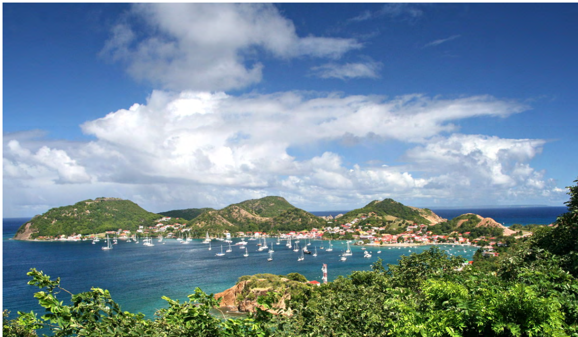
Från berget längst till vänster vakar Fort Napoleon över staden Bourg des Saintes, på ön Terre den Haut i ögruppen Iles des Saintes (Guadeloupe)