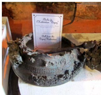
Kyrkklocka, som smälte 1902

Nu får vi vara klara med Martinique. Vårt planerade veckostopp har blivit snart tre veckor och vi har ändå inte fått se en del av det vi ville. Men nu satsar vi på nya platser och seglar vidare norrut!