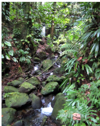
På väg mot fallet och poolen