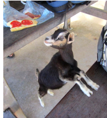
Liten kompis som gärna ville vara med och luncha

Ner för backarna och ut till ostsidan för besök vid öns finaste vik, Pompierre, där man tyvärr inte får lov att ankra. Vinden ligger på mot stranden och det blev för mycket skräp som drev in från båtarna så 1996 satte man stopp för det. Man riskerar böter om man testar. Här fanns fina rastplatser och getter med sina kid gick lösa vid stranden tillsammans med några katter, hönor och lite andra fåglar. Överallt körde vi förbi fina trähus i Gingerbread-stil som det kallas för här.