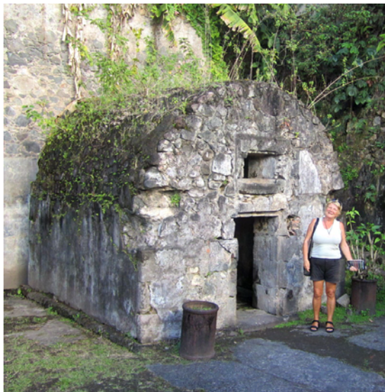
Cyparis bunkerliknande cell