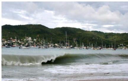
Vågorna rullar in i Admiralty Bay

Året startade rullande! Första dagarna rullade det hela tiden här i Admiralty Bay. Senare fick vi höra att man på Martinique haft rekordmycket swell så det var väl det vi kände av.