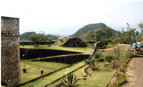
Fort Napoleon med museum och tropisk trädgård

Fort Napoleon vakar över staden från det norra berget så dit gick vår färd. Väl uppe fick vi fin utsikt åt alla håll och en inblick i hur livet varit här under 17- och 1800-talet för fortet är renoverat och är idag ett museum och på dess borggård och murar har man anlagt en tropisk trädgård.