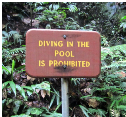
Ingen dykning här!