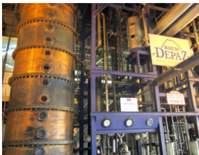
Destillationspannan, där vin blir rom