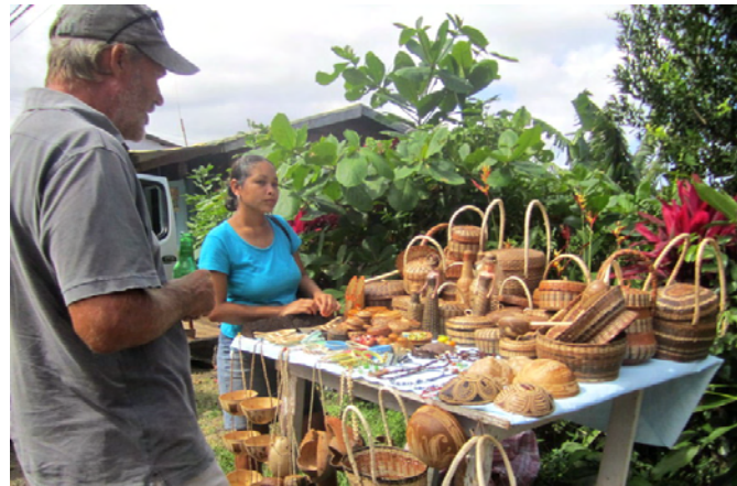
Vi köpte korgar, som är gjorda av ett bambuliknande gräs

Sedan styrde vi mot öns mitt och ett av de vattenfall som finns här.