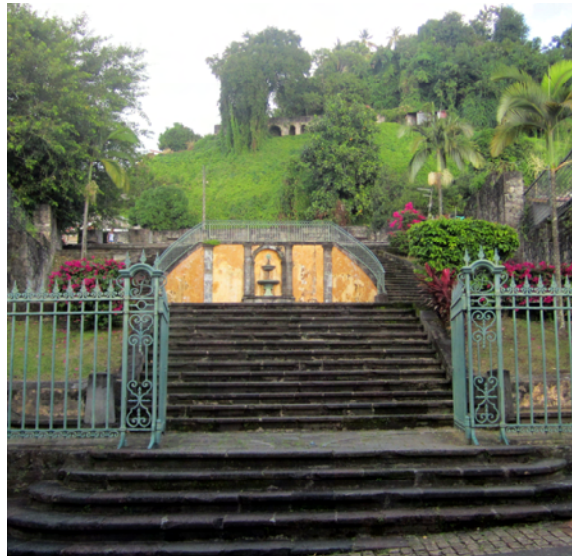
Här låg en teater, med anor från 1700-talet

På redden utanför staden låg 12 fartyg som sjönk, flera av dessa kan man idag dyka ner till. Ett trettionde fartyg tog sig precis härifrån och blev åskådare till katastrofen. Sakta återerövrades staden och idag har de flesta hus någon vägg som härstammar från tiden före vulkanutbrottet. Idag är det mer att likna vid en by, med sina 4 500 invånare, men här finns charm och en känsla som gör att vi trivs.